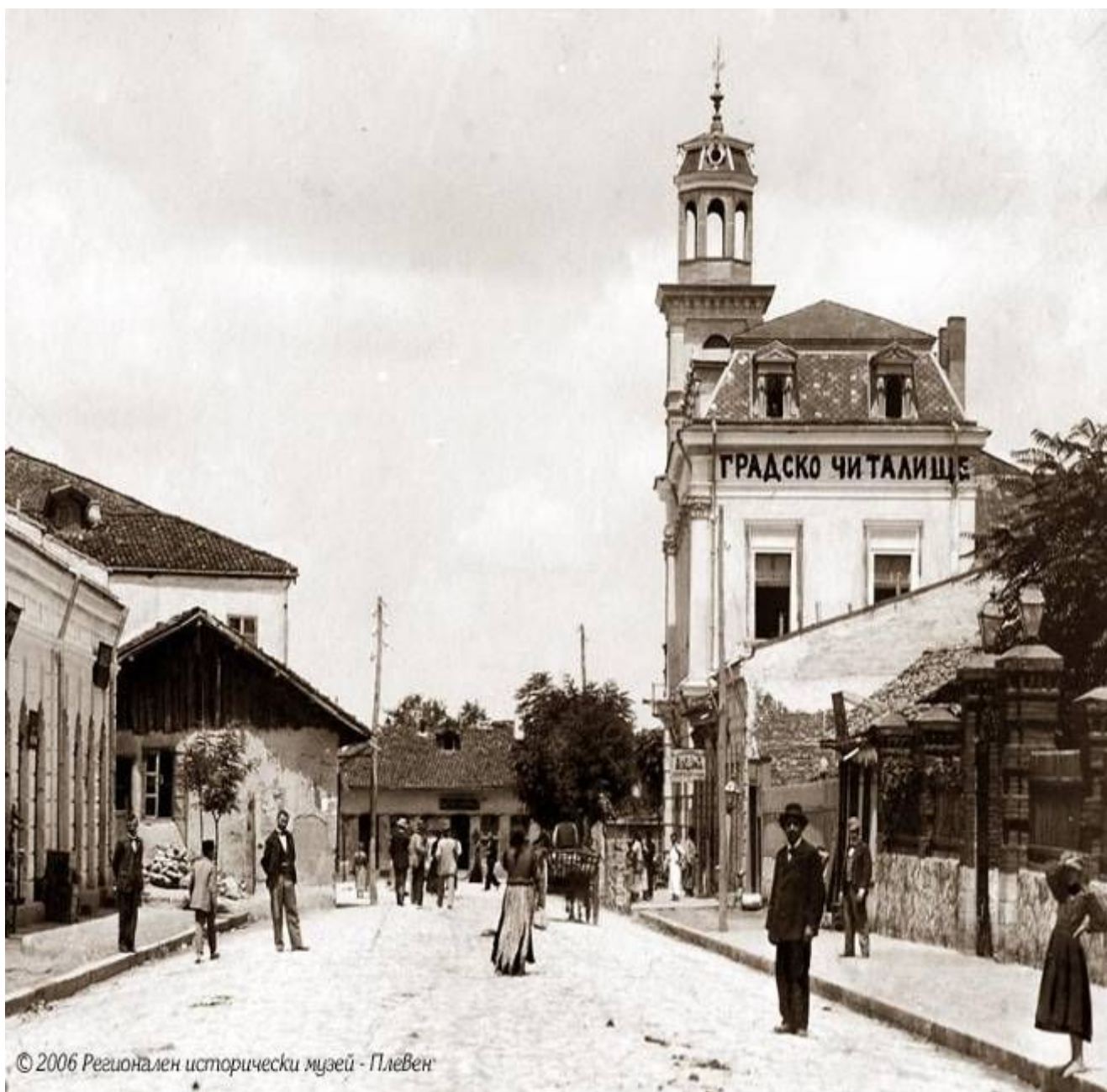
Снимка на старата сграда на читалище „Съгласие“

Според вестник „Народен глас“ от 26.09.1909г шествието по отбелязване на първата годишнина от Независимостта, започва от църквата св. „Николай“, където се отслужва литургия, минава покрай читалище „Съгласие“ и от там продължава към паметника на Руския войн в централния парк на Плевен. И тъй като в тогавашната преса снимките все още не са се сприятелили с текста, сега ви представяме експонати от Регионалния исторически музей, отдел Нова история, с електронен адрес old5 и old6 от pleven.ws